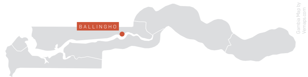
Gambia Map by Vemaps.com

Landesweit einzigartig ist die Integration der Ausbildung in einen landwirtschaftlichen Betrieb. 80% des Unterrichts finden in der Praxis statt. Aus den Produktionserlösen von Gemüse, Obst und Eiern kann die Einrichtung rund 40% der laufenden Kosten selbst finanzieren. Das unternehmerisch ausgerichtete Konzept bereitet die Auszubildenden erfolgreich auf eine praktisch-landwirtschaftliche Tätigkeit vor: Über zwei Drittel von ihnen finden im Anschluss eine Beschäftigung in der Landwirtschaft oder gründen einen eigenen Betrieb.