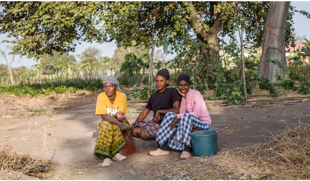
Die Azubis in Gambia leben, lernen und arbeiten im Camp. Hier finden sie oft auch Geschäftspartnerinnen und -partner für ihre zukünftigen Unternehmungen.